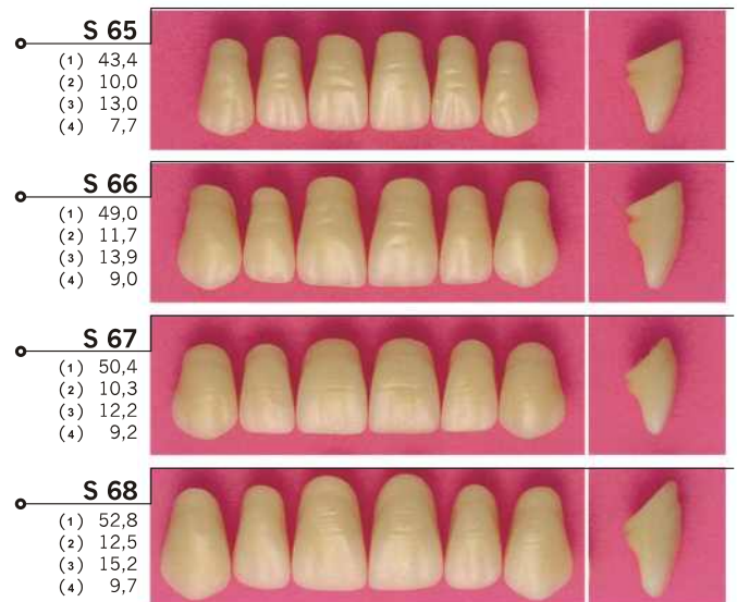
TABELLA DI ARTICOLAZIONE